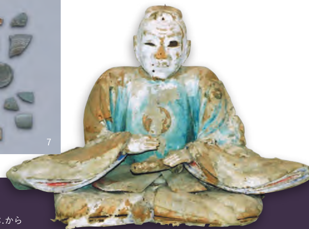
西園寺公広坐像 西予市光教寺蔵(愛媛県歴史文化博物館管理)