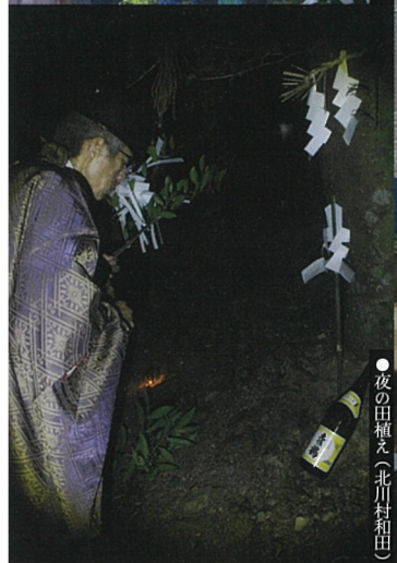
●夜の田植え(北川村和田)