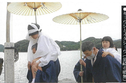
●ギョウジとイタシヨウ(須崎市鴨無)