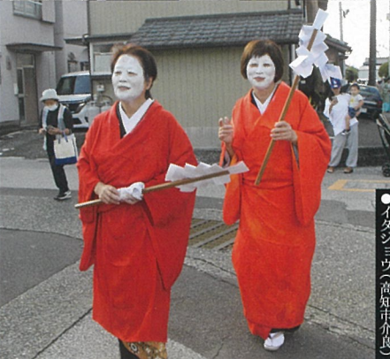
●イタシヨウ(高知市介良)