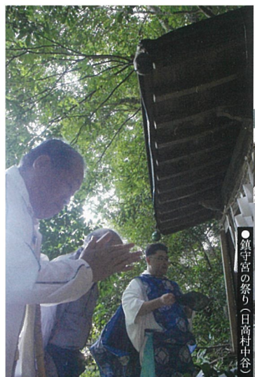
●鎮守宮の祭り(日高村中谷)

車でのアクセス ●高知市中心部から約20~30分、高知自動車道南国ICから約10分、高知ICから約15分、高知龍馬空港から約20分 路線バス ●(比婆でん交通)はりまや橋・JR高知駅から南国オフィスパーク・新石行き(65・6)(1時間に1~2便)、[南国市コミュニティバス]後免町・大津駅前から医大病院方面行き(1日2便) いずれも[学校分岐(歴史館入口)]下車、徒歩15分