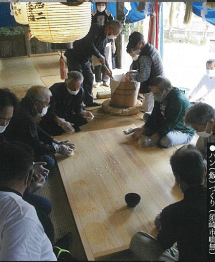
●ハン飯づくり(須崎市鴨無)