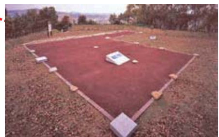
ฐานใจกลางปราสาท การฟื้นฟูซากสิ่งก่อสร้างของตัวฐานหิน