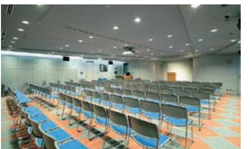
ห้องโถงเอนกประสงค์

(รองรับได้ 150 ท่าน) สำหรับจัดงานอบรมและการบรรยายต่างๆ สามารถใช้เป็นสถานที่ประชุมและสัมมนาได้ (มีค่าใช้จ่ายเพิ่มเติม·สมัครล่วงหน้า)