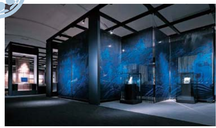
จัดแสดงประวัติศาสตร์และวัฒนธรรมของจังหวัดโคจิจากเอกสารทางประวัติศาสตร์ โบราณคดี คติชาวบ้านตั้งแต่ยุคแรกเริ่มจนถึงปัจจุบัน