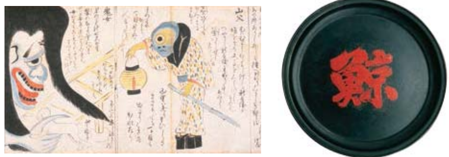
บันทึกตำนานผีโทสะโอบาเกะโชชิ (สำเนา) จากต้นฉบับของคุณโฮริมิ ทาดายชิ งานลงเงาเคลือบขนาดใหญ่คุระโนะโอบาคาซึกิ