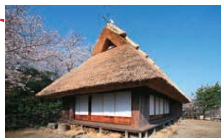
เรือนหลักหลังที่ 1 ของตระกูลมิโนโตะ (เคลื่อนย้ายมาจากหมู่บ้านเบนซา) (ขึ้นทะเบียนสมบัติทางวัฒนธรรมแบบจับต้องได้ เมื่อวันที่ 28 เมษายน 2000)