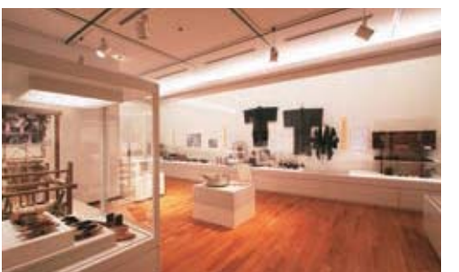
ห้องจัดแสดงผลงานพิเศษ

การจัดแสดงผลงานพิเศษตามหัวข้อที่กำหนด ถูกจัดขึ้นปีละหลายครั้งโดยการสำรวจวิจัยของผู้เชี่ยวชาญด้านพิพิธภัณฑ์