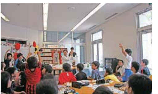
ห้องเรียนผ่านประสบการณ์

สามารถเลือกอ่านหนังสือเกี่ยวกับประวัติศาสตร์ของจังหวัดโคจิได้ตามอัธยาศัยและยังใช้เป็นห้องเรียนพูดคุยอย่างสนุกสนาน(ห้องเรียนประวัติศาสตร์ของเด็กๆ) อีกด้วย