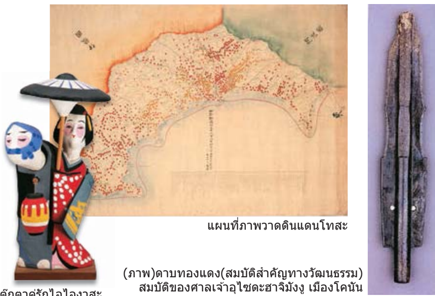
แผนที่ภาพวาดดินแดนโทสะ (ภาพ) ตามทองแดง (สมบัติสำคัญทางวัฒนธรรม) สมบัติของศาลเจ้าอิโซเดะฮาจิมัง เมืองโคจินัน ตึกตาคูรักไอโองาสะ