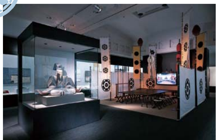
จัดแสดงเอกสารและวัตถุสิ่งของที่เกี่ยวข้องกับตระกูลโจโซคาเบะและ ซากปราสาทโอโกะ (ร่องรอยทางประวัติศาสตร์แห่งชาติ) พื้นที่ตรงกลางจัดแสดงเหล่านักรบของโจโซคาเบะในสมัยศึกแม่น้ำนาคาโทมิงว่า ให้ผู้เยี่ยมชมได้สัมผัสถึงบรรยากาศในยุคเซ็นโงกุ