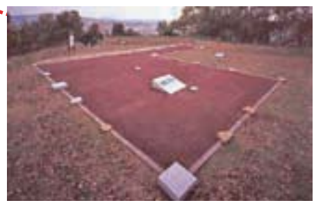
오코 성터 쓰메(병사 주둔소) 복원

당 자료관이 향토사를 배우고, 사람과 사람과의 만남의 장소가 되어, 보다 좋은 미래를 구축하기 위한 발판이 되기를 바라고 있습니다.