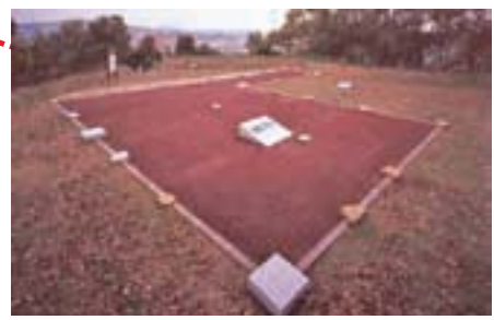
冈丰城迹 诘 复原

高知县立历史民俗资料馆作为高知县历史系综合博物馆, 自1991年5月开馆以来, 深受大家的喜爱, 被亲切地称为“历民馆”。馆内收藏着县内历史·考古·民俗的各领域资料, 并对其进行调查, 研究成果通过常设展览·企划展览为首的演讲会、展览室解说、儿童历史教室、及“展览图册”、“研究学刊”等公布于众。另外, 博物馆所在地冈丰山是战国时代长宗我部氏的故居 (国史迹·冈丰城迹) 的所在地, 是一座既可以悠闲地散步又可以了解历史的公园。 2010年4月, 根据最新的研究成果, 为使常设展示更具亲民性和灵活性, 资料馆进行了装修, 并更新了大量展览资料。另外, 为体现本馆处长宗我部氏故居附近的特点, 还设立了展有长宗我部氏和冈丰城迹相关资料的长宗我部展览室。 本馆是一个既可以了解乡土的过去, 又可以与人相识的场所, 希望可以成为大家构筑更加美好明天的立足点。