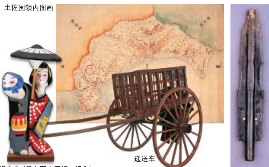
相合伞 (男女两人同打一把伞)