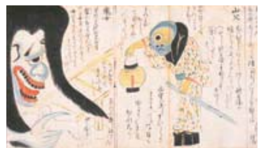
土佐鬼怪画册 (复制品) 堀见忠司氏收藏着原资料