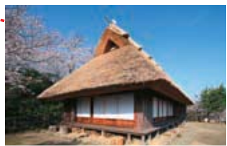
旧味元家住宅主屋 山村移筑民家 (登记为有形文化财产·2000年4月28日登记)